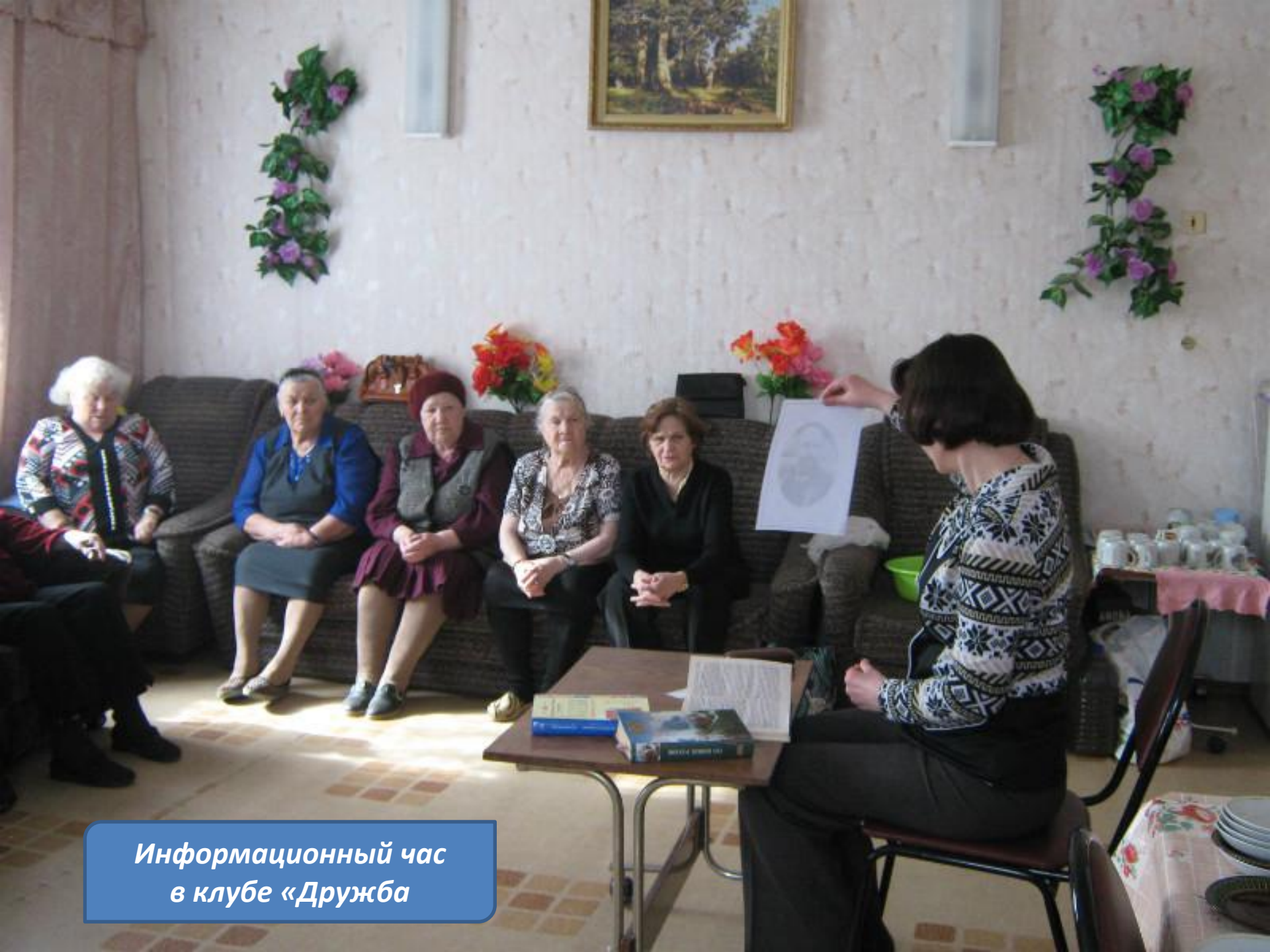
Информационный час в клубе «Дружба»