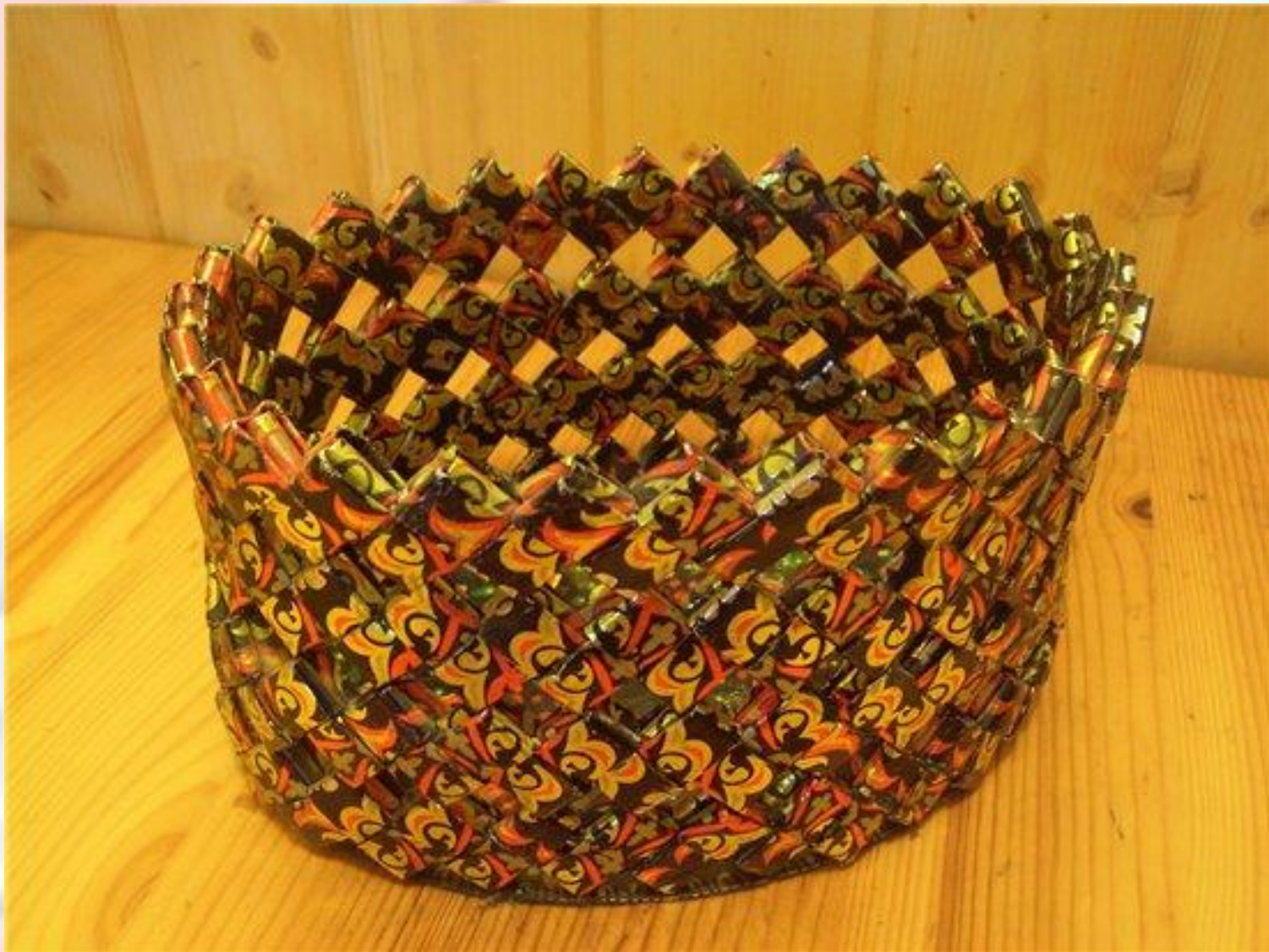
Конфетница в стиле хохломы.